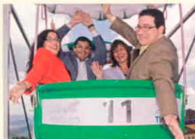
Los autores de Shock!